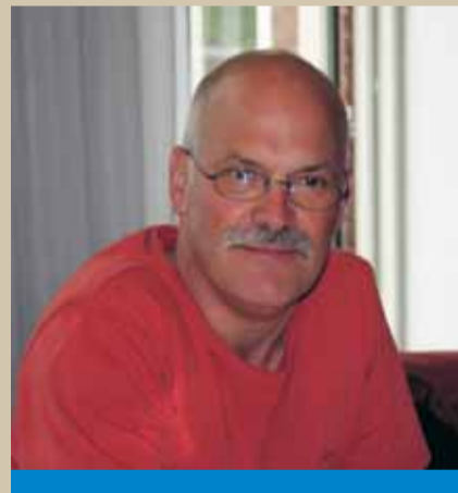
"Medezeggenschap is compromissen sluiten."

Medezeggenschap is compromissen sluiten, van twee kanten. In gesprek met elkaar haal je de scherpe kantjes eraf. Ook al zijn we het niet altijd eens met de managers, er is wel het vertrouwen dat we er met elkaar uitkomen."