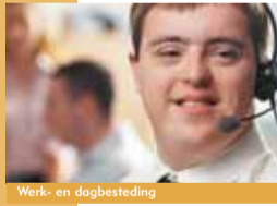
Werk- en dagbesteding