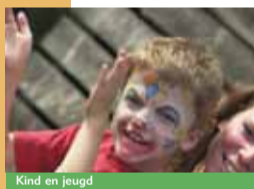
Kind en jeugd