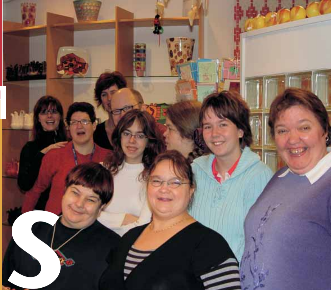
De medewerkers van winkel 't Klein Verschil in Bavel heten u van harte welkom!

Heeft u een vraag over onze dienstverlening? Wilt u meer weten over de campagne? Of wilt u informatiemateriaal van Amarant ontvangen? Bel dan met Amarant: 0900 – 8066. Binnen 24 uur krijgt u een antwoord van Amarant.