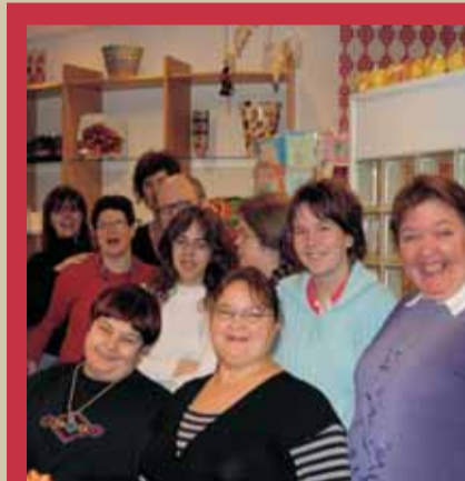
Neem ook eens een kijkje bij 'T klein Verschil in Bavel. Het winkelpersoneel staat voor u klaar!

Huiswinkel Rijsbergen, De Polder 1, Rijsbergen, 076 - 596 75 70 Huiswinkel D. de Brouwerpark, Bredaseweg 570, Tilburg, 013 464 54 44 Huiswinkel 't Hooge Veer, Bredaseweg 375, Tilburg, 013 465 22 55