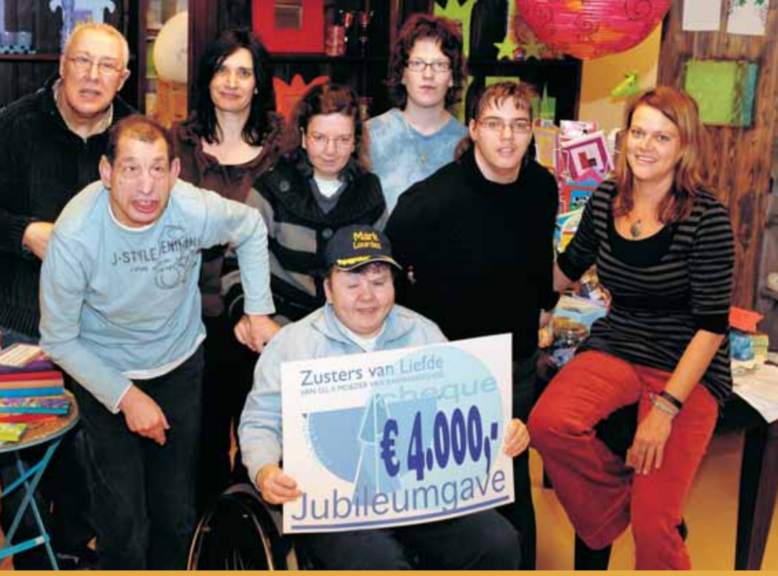
'T klein Verschil in Tilburg is blij met het geldbedrag van de Zusters van Liefde

Zusters van Liefde enthousiast over winkel/atelier