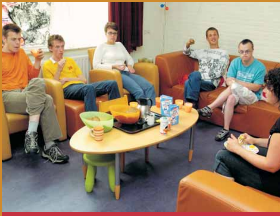
Het budget dat hoort bij het ZZP wordt besteed aan individuele zorg en persoonlijke begeleiding, maar ook voor zaken die plaatsvinden in groepsverband, bijvoorbeeld met medebewoners.

De voorbereidingen zijn in volle gang, met vooralsnog de conclusie: intentie prima, uitvoering kan beter.