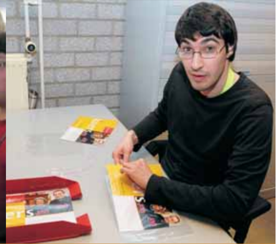
Het team van de Tongerlose Hoef werkt samen met drukkerij Groels.