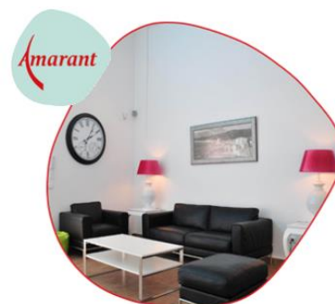
Huiskamer schoonmaken werkboek

Succes! Meer vragen over schoonmaken of andere cursussen? Neem dan contact op met Leercentrum@amarant.nl