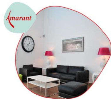
Huiskamer schoonmaken werkboek

Succes! Meer vragen over schoonmaken of andere cursussen? Neem dan contact op met Leercentrum@amarant.nl